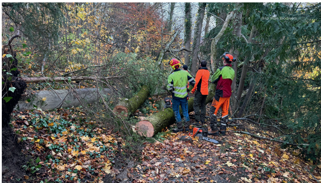
Outre la production de bois, l'entretien des chemins fait également partie des travaux forestiers.