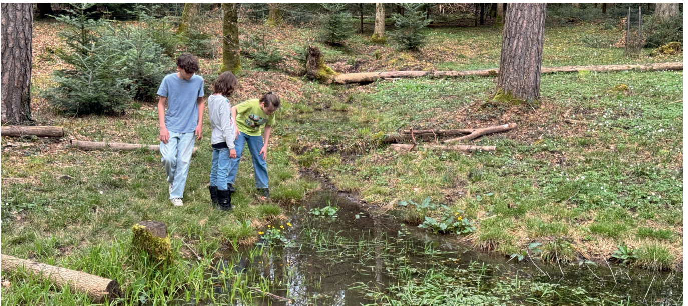
Particulièrement riches en espèces, les forêts claires et humides sont rares.

Pour les propriétaires forestiers, l'Initiative biodiversité représente l'opportunité de recevoir davantage de contributions pour autant qu'ils acceptent une réserve forestière ou s'engagent en faveur de la biodiversité.