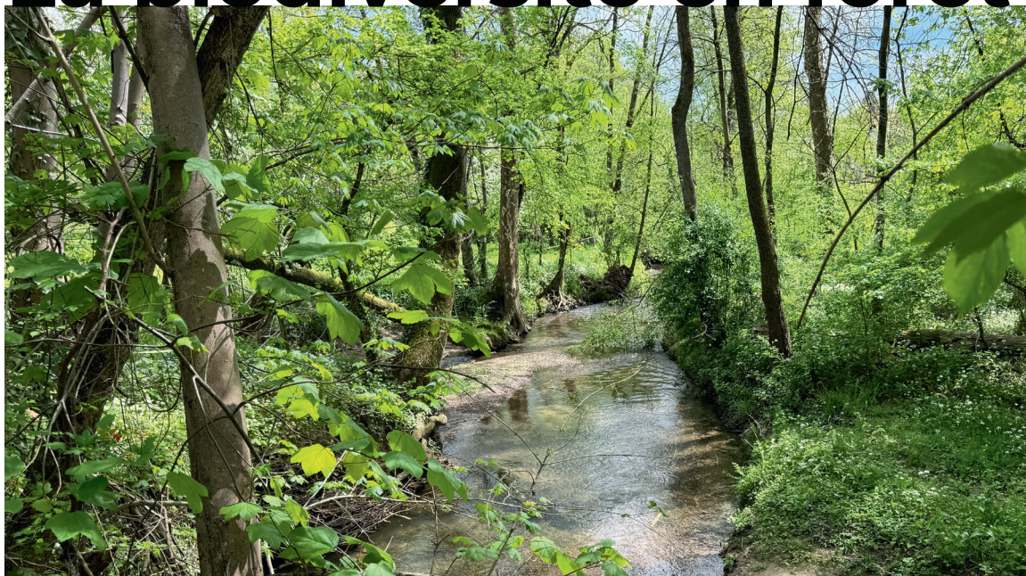
La forêt garantit l'essentiel de notre eau potable.

Les forêts recouvrent un tiers du territoire suisse. Elles abritent plus de la moitié des espèces connues dans notre pays, soit près de 30 000. Grâce à des dispositions légales ciblées, mais aussi à la compréhension des besoins liés à la biodiversité de la part de nombreux sylviculteurs et propriétaires de forêts, la situation y est nettement meilleure que dans d'autres milieux naturels. Des lacunes subsistent toutefois ainsi que d'importantes différences régionales. On trouve par exemple encore, en de nombreux endroits, des forêts commerciales uniformes. L'Initiative biodiversité contribue à concilier la production de bois et la biodiversité en forêt.